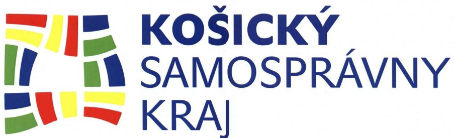
Logo Košického samosprávneho kraja

Pri farebnom vyobrazení loga Košického samosprávneho kraja sú záväzné farby vzorkovníka „Pantone“ :